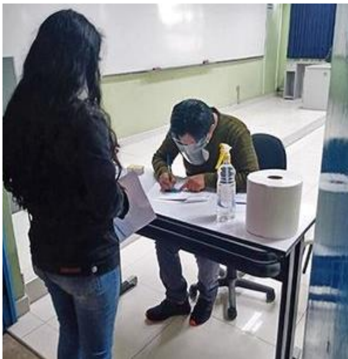
Entrega de chips, con internet ilimitado, para alumnos y docentes.