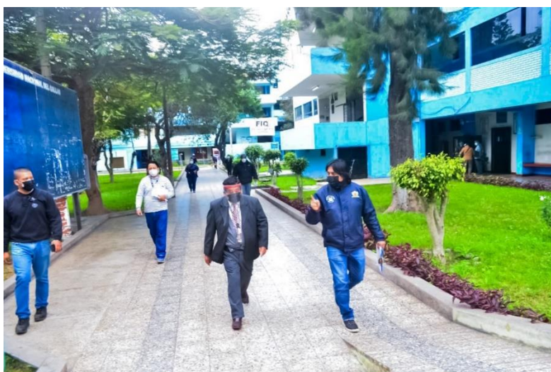
Actividades en la Ciudad Universitaria