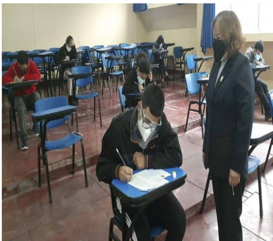
Primer examen de admisión presencial post cuarentena