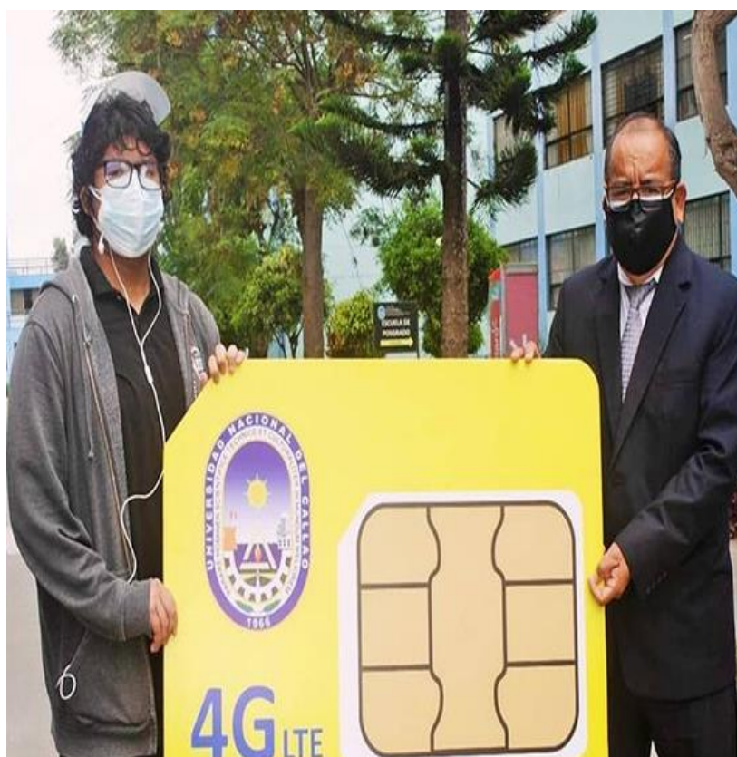
Entrega del Chip a los alumnos de Pregrado de la UNAC