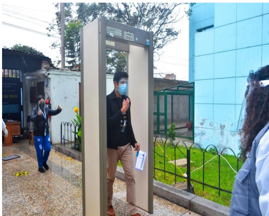
Implementación de protocolos de bioseguridad frente al Covid-19 en la Ciudad Universitaria